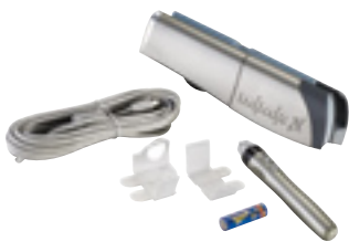
mimio® Interactive Bar, mimio® Maus, USB-Kabel, Batterie für die mimio® Maus, Befestigungsklammern