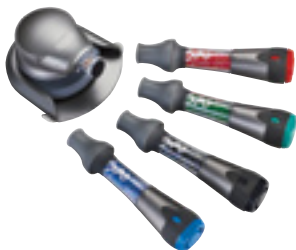
mimio® Capture Kit erfasst die Dry-erase Marker digital