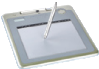
mimio® Pad haben Sie im ganzen Raum die Kontrolle über Ihr System