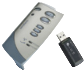
mimio® Wireless Modul und USB-Empfänger